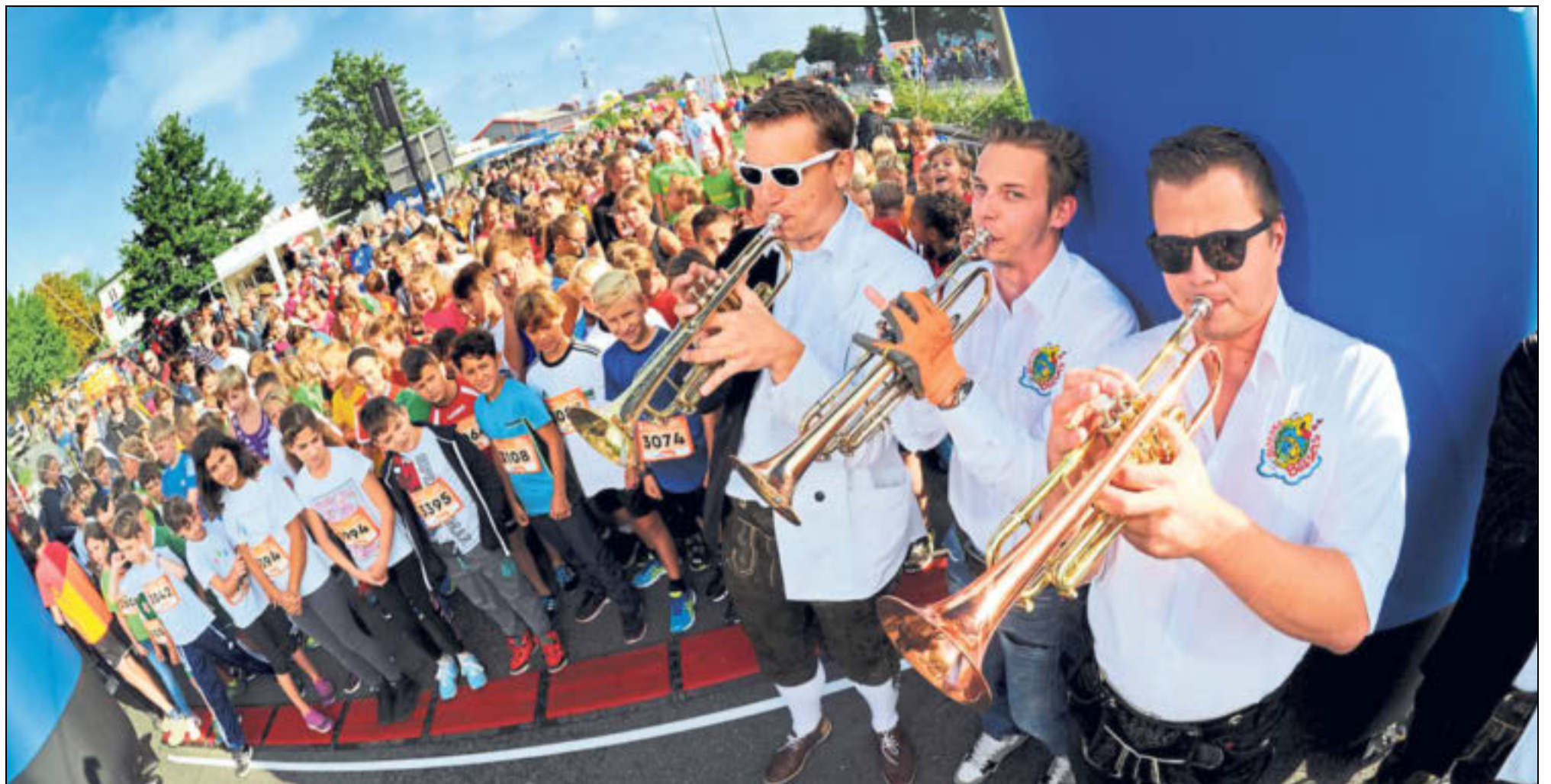
Run & Play: Vor dem Start des Schülerlaufs mit 2149 Teilnehmern geben die Musiker der Marching-Band »Blaanke Bössels« den Ton auf dem Ostwestfalendamm an.